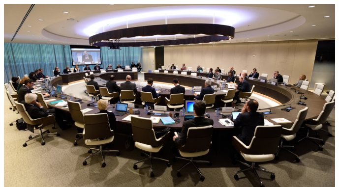
Σύμφωνα με τη φορά των δεικτών του ρολογιού: Στιγμιότυπο από τη σύνοδο του Ευρωπαϊκού Συμβουλίου στο Τάμπερε της Φινλανδίας, το κτίριο της Eurojust στη Χάγη, αίθουσα συνεδριάσεων και αίθουσα επιχειρησιακών δραστηριοτήτων